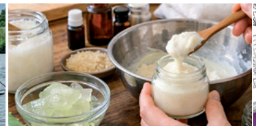
DIY Bodylotion Lab

Ein lizenziertes Trainer wird dich in die Basics des Stand-Up-Paddlings einweisen. Anschließend geht es mit dem Board auf den Main. Deine ersten Paddelversuche kannst du noch auf den Knien machen. Danach lernst du, sicher auf dem Board zu stehen und die richtige Position einzunehmen. Außerdem erfährst du, wie du den Paddelwechsel durchführst und das Board mithilfe von Bogen- oder Stoppschlägen drehst.